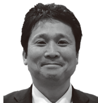
(株)グリーン・エナジー 代表取締役